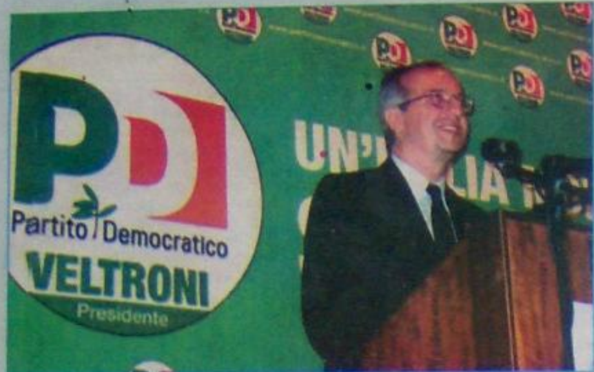
Veltroni ieri a colloquio con i vertici regionali del Pd molisano